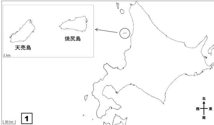
図1. 天売島および焼尻島の位置 (地理院地図を改変).